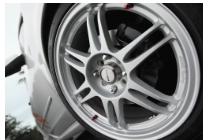
Leicht, aber nicht übergross: der Kraft angepasste 17-Zöller.