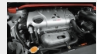
Solides Handwerk: Dokumentierte 192 PS und 247 Nm steigern die Beschleunigung.

Messungen: auto-illustrierte, Temp. 13 °C, km-Stand 13850, Yokohama Parada.